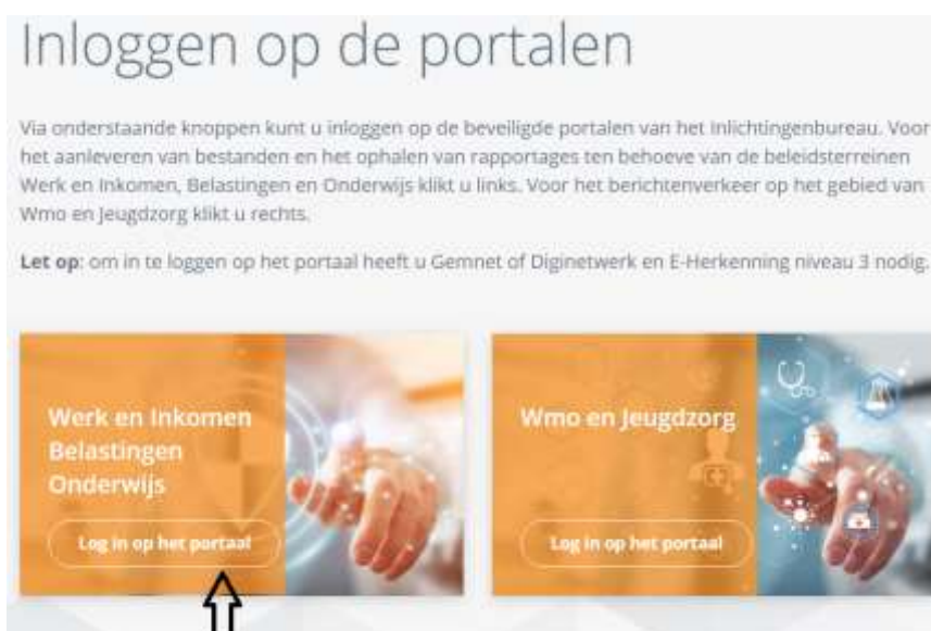
Afbeelding 1: Inloggen 1

Wilt u zich als gebruiker aanmelden voor het product LKS start einde zw? Vul dan het dan het aanmeldformulier 'nieuwe gebruiker Informatiesysteem Inlichtingenbureau' in op de site.