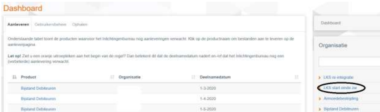
Afbeelding 2: Dashboard

U landt na het inloggen op uw dashboard, uw overzichtspagina met betrekking tot alle producten die u afneemt. Kies uit de rechterkolom het product 'LKS start einde zw'.