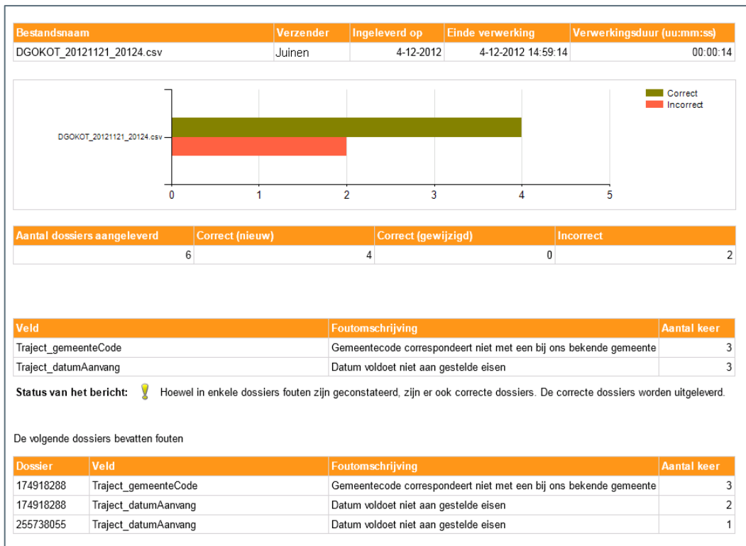
Figuur 3 Verwerkingsverslag

Figuur 4 toont een detailblok van het verwerkingsverslag van een correct aangeleverd bestand met 5 incorrecte dossiers. In totaal zijn in figuur 4, 5 dossiers aangeleverd die allemaal incorrect zijn. In de bovenste balk wordt de bestandsnaam, de verzender, de inleverdatum, einde verwerking en de verwerkingsduur van het bestand getoond.