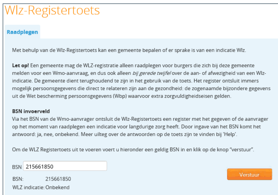
Figuur 7. Antwoord is Onbekend op Wlz-Registertoets

*Zie Amendement van de leden Otwin van Dijk en van 't Wout, TK 33 891, nr. 107 en de VNG Ledenbrief Gevolgen 14.000 Wlz indiceerbaren, 21 oktober 2014