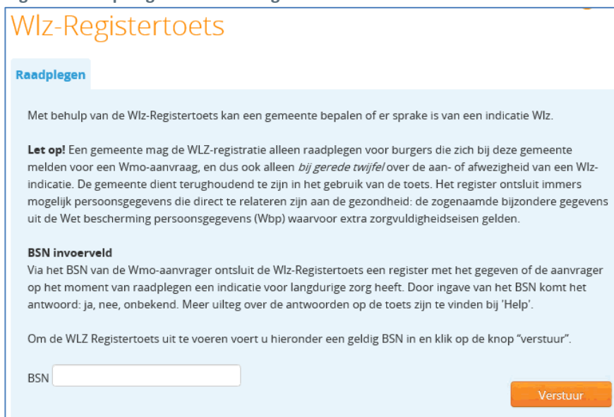
Figuur 1 Raadpleegscherm Wlz-Registertoets

2. Voer een geldig BSN in en klik op de knop "verstuur". Via het BSN van de Wmo-aanvrager ontsluit de Wlz-Registertoets een register met het gegeven of de aanvrager op het moment van raadplegen een indicatie voor langdurige zorg heeft. Door invoer van het BSN komt het antwoord: ja, nee, onbekend. Een dag later kan de indicatie anders zijn. Zie paragraaf 'Uitleg van antwoorden op Wlz-Registertoets' voor uitleg over de uitkomsten.