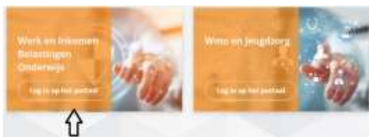
Afbeelding 2: Inloggen