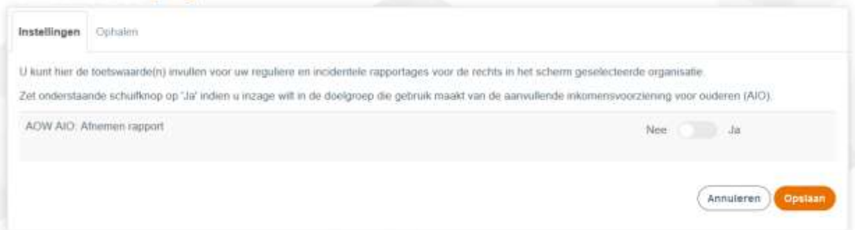
(Afbeelding 1: tabblad instellingen: Zet de schuifknop op 'Ja' om het rapport af te nemen)